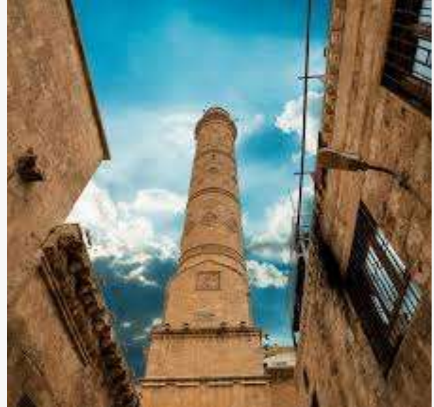
Ulu Camii, Mardin'in en eski camisi.