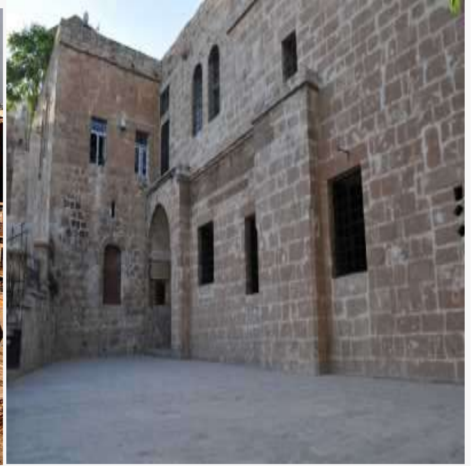
Hatuniye Medresesi, dönemin işçiliğini gözler önüne seriyor.