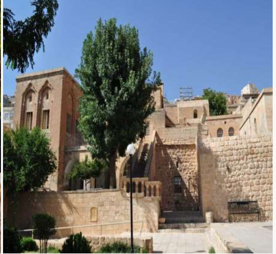
Mardin'de mutlaka görülmeli gereken eserler arasında Mor Behnam Kilisesi de bulunuyor.