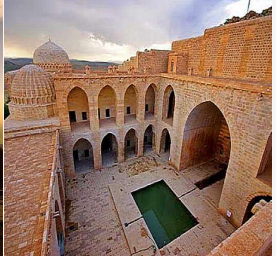
Zinciriye Medresesi, tarihin büyüğü sayfalarında yol alacak, rüzgarı hissederek geçmişe tanıklık edeceksiniz.